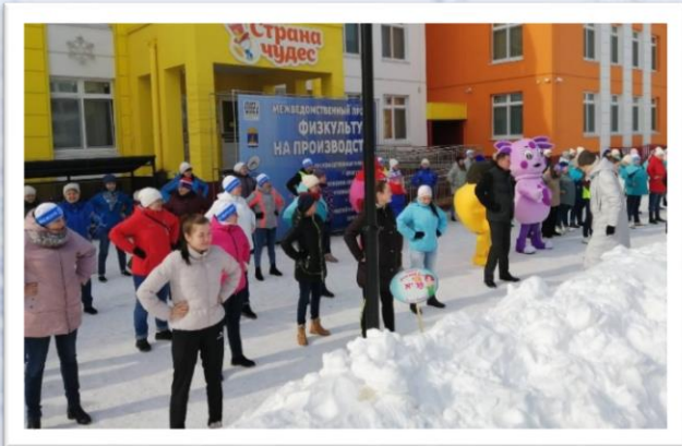
Физкультура на производстве