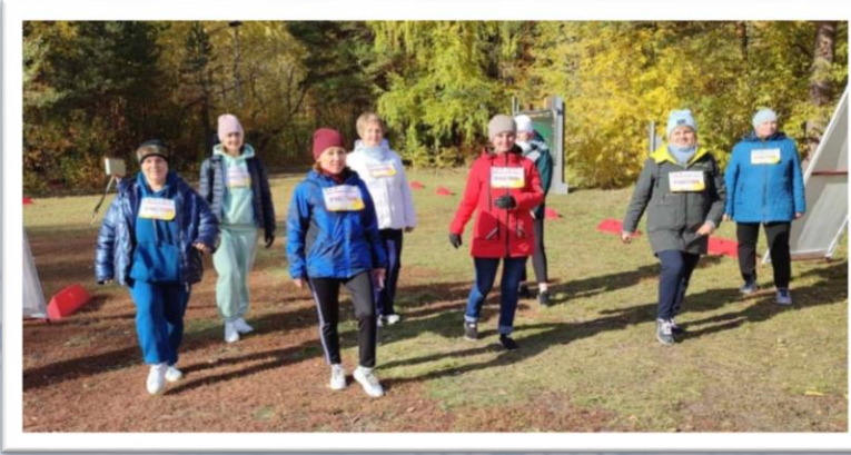
Спартакиада работников образования