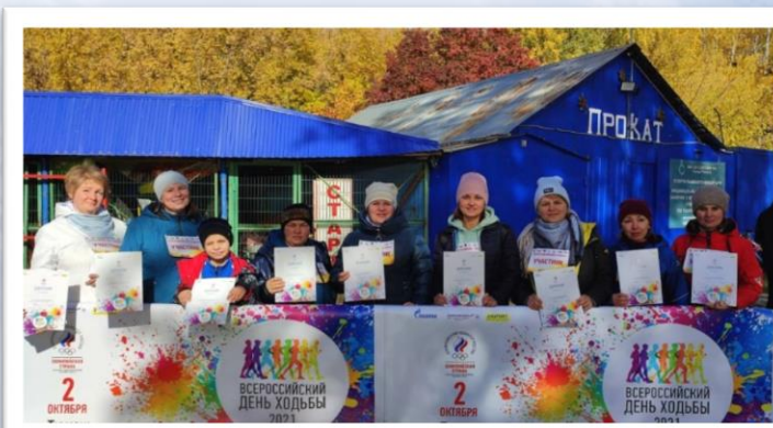
Всероссийский день ходьбы